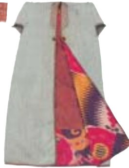
被衣（バンジャ）20世紀 絹 綿

緋（かすり）とは、模様がところどころかすれたようなモチーフを規則的に配した織物。たて糸が絹、よこ糸が綿の経緋<アドラス>はウズベク人たちに好んで用いられた。