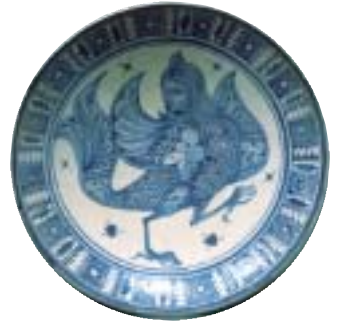
皿 20世紀 タシュケント

イスラーム陶器の伝統を受け継いだ現代の匠たちが作り出す陶器は、地域と民族の嗜好を反映して色彩に独自性を見せている。