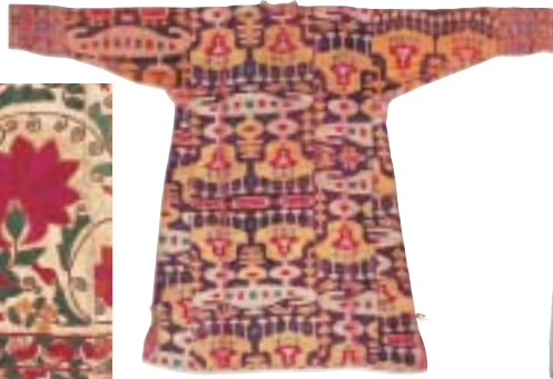
コート（ムルサク）19世紀 ベルベット 絹

スザニは現在のウズベキスタンを中心に作られた婚礼用刺繍布で、赤い円文や花蔓草文を特徴とし、壁掛けやベッドカバーに用いた。