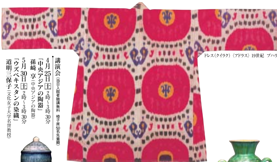
ドレス(クイラク)〈アドラス〉19世紀 プハラ