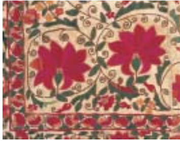
掛布（スザニ）部分 20世紀 絹・綿

スザニは現在のウズベキスタンを中心に作られた婚礼用刺繍布で、赤い円文や花蔓草文を特徴とし、壁掛けやベッドカバーに用いた。